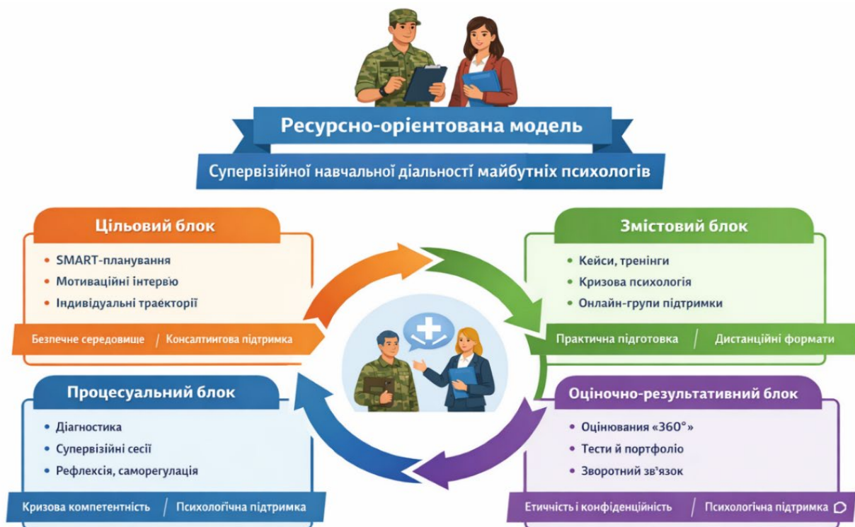
Рис. 2. Ресурсно-орієнтована модель супервізійної навчальної діяльності майбутніх психологів в умовах воєнного часу: консалтинговий підхід (текст авторський, візуалізацію згенеровано ШІ Chatgpt)

Для кращого сприйняття можливостей реалізації консалтингового підходу у ресурсно-орієнтованій моделі супервізійної навчальної діяльності майбутніх психологів в умовах воєнного часу створено рисунок 2.