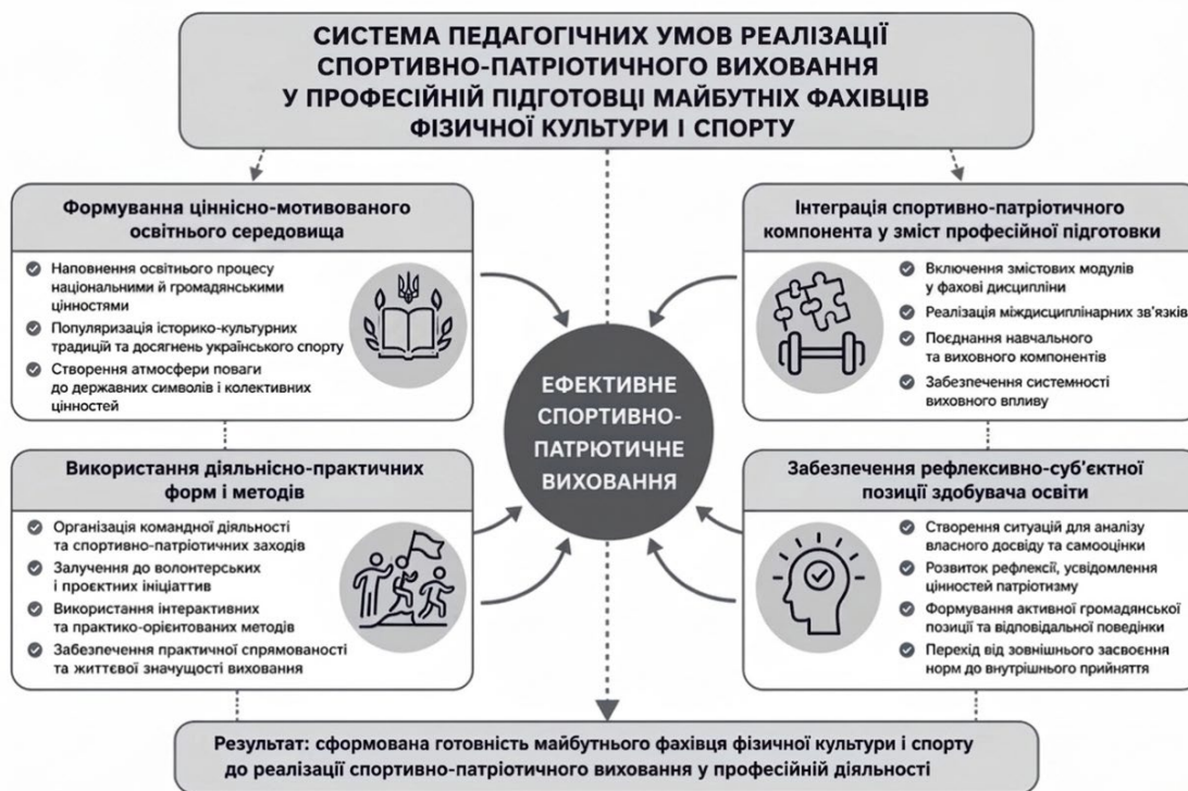
Рис. 2. Система педагогічних умов реалізації спортивно-патріотичного виховання у професійній підготовці майбутніх фахівців фізичної культури і спорту

і ефективність спортивно-патріотичного виховання, дозволяє досягти узгодженості між знаннями, цінностями та поведінкою особистості майбутнього фахівця.