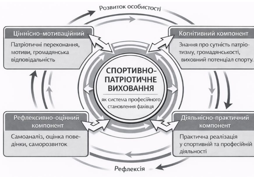
Рис. 1. Структура спортивно-патріотичного виховання як динамічної системи

Взаємозв'язок та ієрархічна підпорядкованість компонентів структури спортивно-патріотичного виховання дозволяють представити цей феномен як динамічну систему, де кожен складник виконує специфічну функцію у процесі становлення особистості майбутнього фахівця, рис. 1.